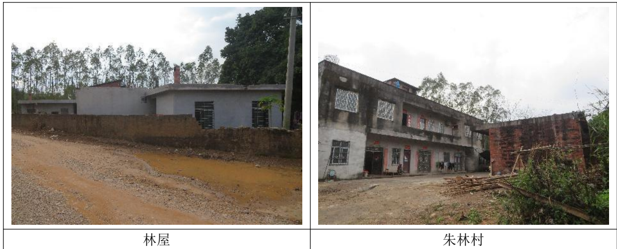
图 1.8-1 环境敏感点照片