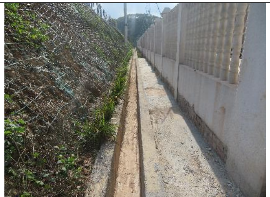
升压站外设置排水沟