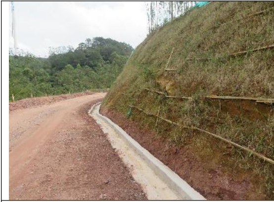
场内道路沿线排水沟