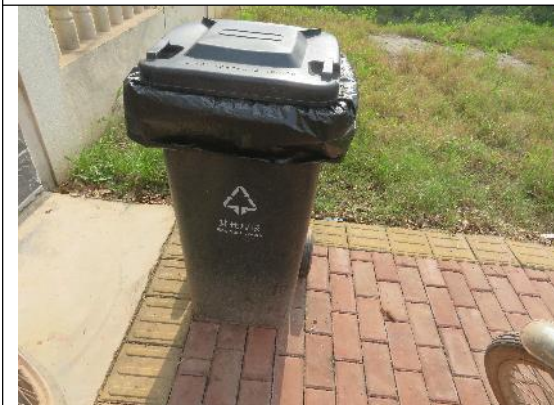
升压站设置垃圾桶