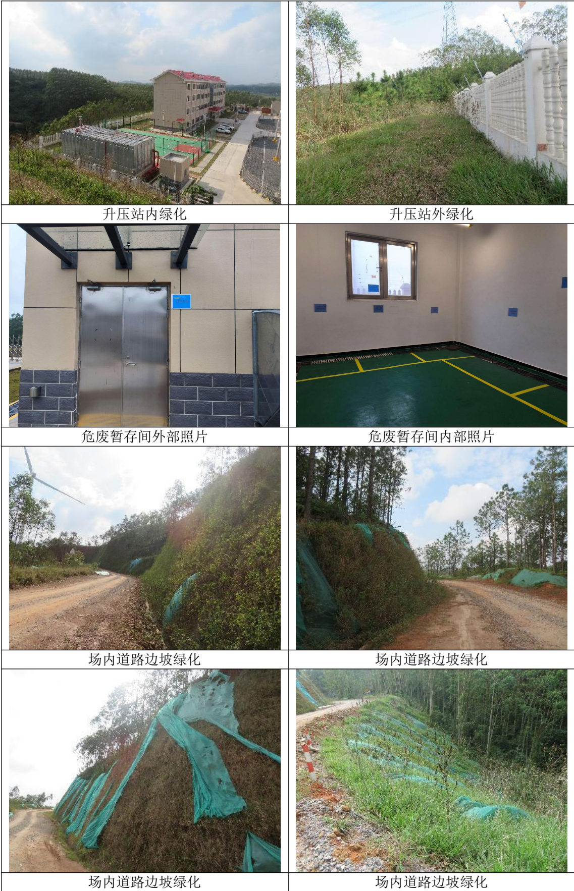
图 4.3-1 龙滩风电场环保措施落实照片