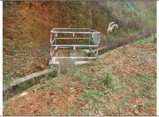
场内道路沿线排水沟及沉砂池