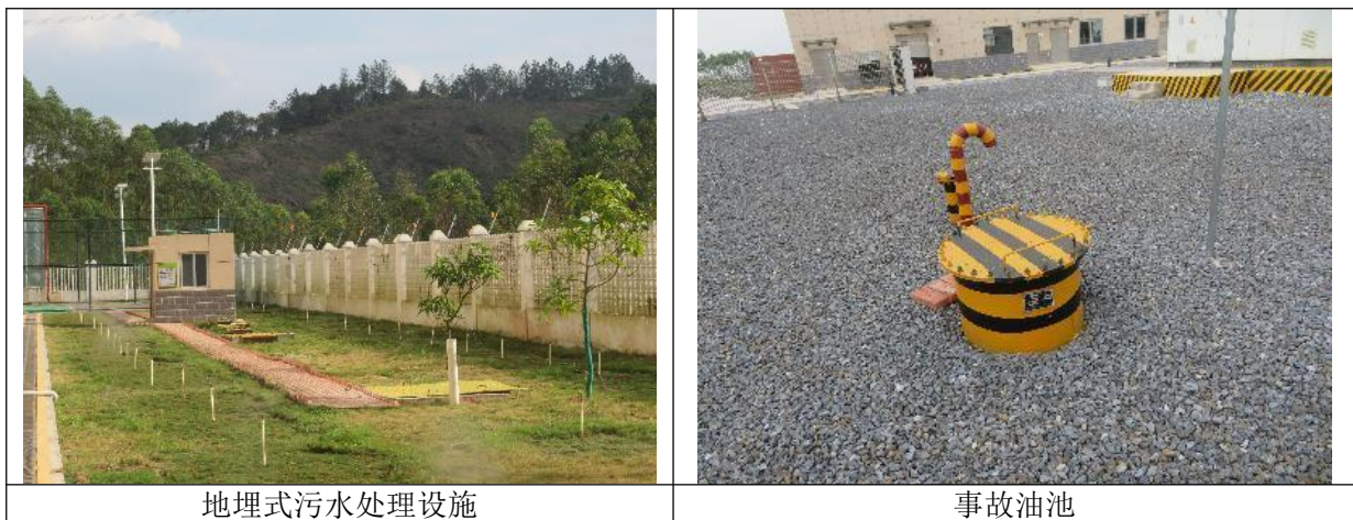
图 5.2-2 试运行期水环境保护措施照片

升压站内设化粪池、调节池和地埋式一体化污水处理设施处理运行人员生活污水，风电场运行期间，升压站内常驻人员为 8 人。为了解污水处理设施运行及出水水质情况，本次污水监测主要采集污水进水口水样和污水出水口水样，污水处理设施处理后水质均满足《污水综合排放标准》（GB8978-1996）一级标准。污水经处理后，用于站内绿化，不外排，对周边地表水环境无影响。